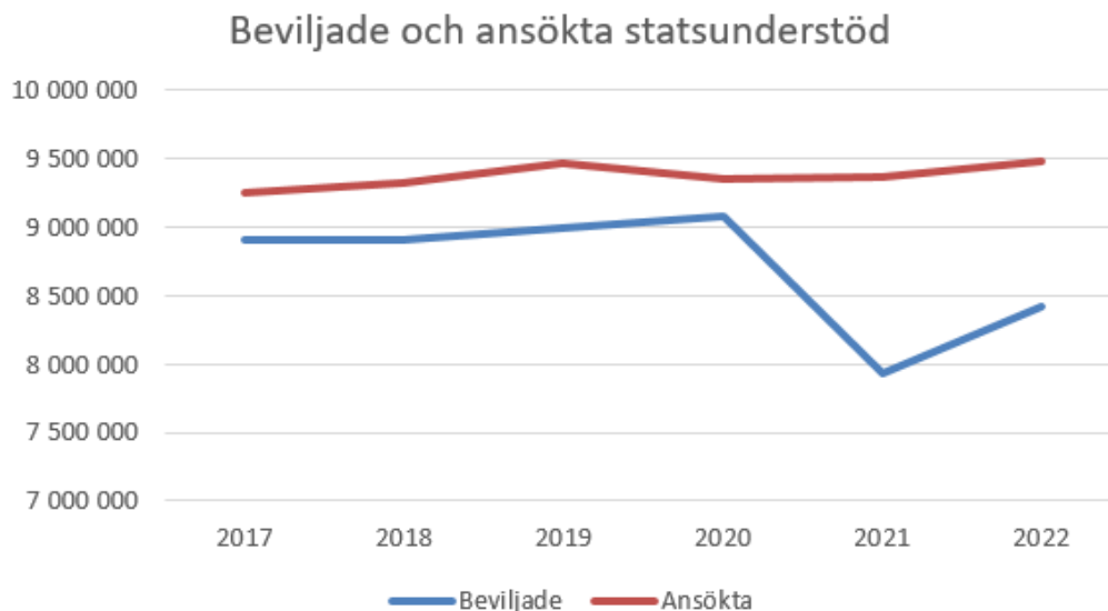
Figur 2. Jämförelse av ansökta och beviljade statsunderstödsbelopp (allmänt understöd) under olika år.

Under hela den tid som lagen har varit i kraft har det ansökts om mer statsunderstöd än vad som slutligen har beviljats. I synnerhet 2021 minskade anslagen för främjande av vägtrafiksäkerheten, vilket också påverkade de statsunderstöd som beviljades. Till följd av statsunderstödens karaktär av reservationsanslag kan de medel som blivit oanvända ett år dock användas också följande år. Karaktären av reservationsanslag har sedan 2020 utnyttjats i fråga om de statsunderstöd som beviljats Trafikskyddet och Trafikförsäkringscentralens Institut för Olycksinformation. På grund av covid-19-pandemin var mottagarna av statsunderstöd tvungna att anpassa sin verksamhet och all den planerade verksamheten genomfördes inte, vilket innebar att en del av kostnaderna inte heller uppstod. De medel som blev oanvända 2020 kunde således användas 2021 för att åtgärda den lägre anslagsnivån.