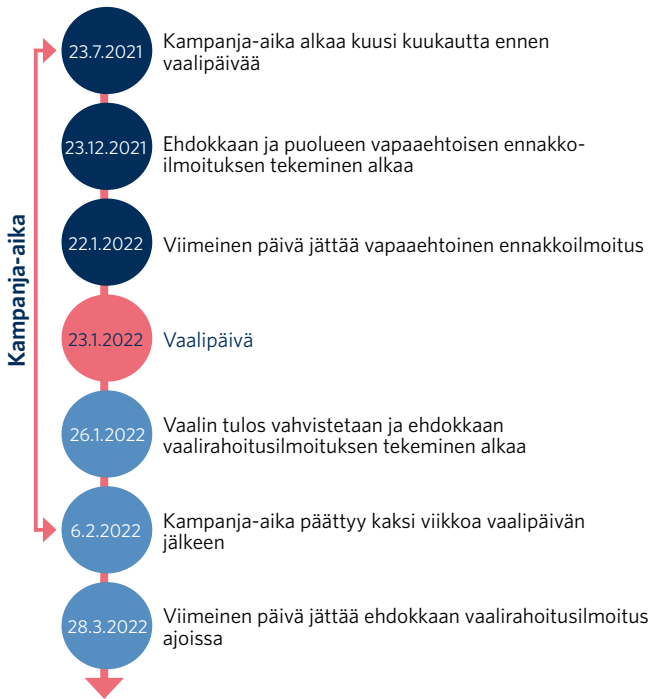
Kuvio 1: Aluevaalit 2022 aikajanalla.

Tarkastusviraston on pidettävä aluevaaleja koskevat tiedot saatavilla yleisessä tietoverkossa viiden vuoden ajan vaalien tuloksen vahvistamisesta. Kaikki aluevaalien vaalirahoitusilmoitukset ja ennakkoilmoitukset (ks. luku 3.1) pidetään verkkosivuilla yleisön saatavilla 26.1.2027 saakka.