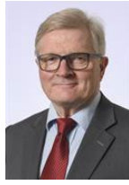
VARAPUHEENJOHTAJA Johannes KOSKINEN (sd.)