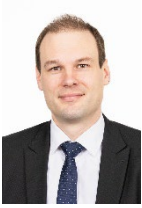
PUHEENJOHTAJA Ville KAUNISTO (kok.)