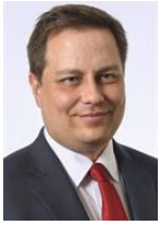
PUHEENJOHTAJA Vilhelm JUNNILA (ps.)